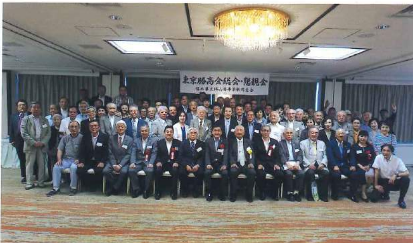
最後に、全員で記念写真を撮影しました。